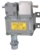
модель GD-D8V для горючих и токсичных газов