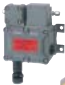
модель GD-D8 для горючих газов

Взрывозащита РФ: №2001.C243 / № PPC 04-7218