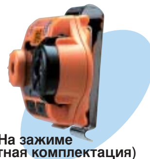
На зажиме (стандартная комплектация)