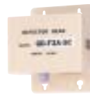
модель GD-F3ASC для кислорода